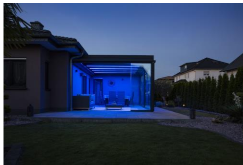
Bilder 7a und 7b:

In die Dachträger integrierte Farb-LED-Bänder schaffen ein stimmungsvolles Ambiente auf der abendlichen Terrasse.